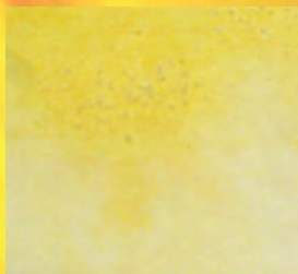
METAMFETAMINE / MDMA