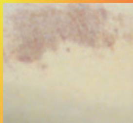
HEROÏNE / OPIUM