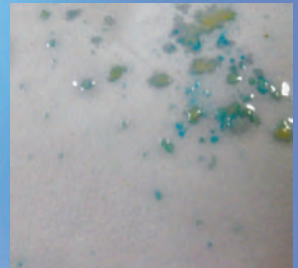
BLAUWE VLEKKEN (CRACK)

ALS EEN POSITIEVE REACTIE OPTREEDT, DIEN HET BEWIJSMATERIAAL AAN EEN VERDERE LABORATORIUMANALYSE ONDERWORPEN TE WORDEN, IN OVEREENSTEMMING MET HET PROTOCOL VAN UW AGENTSCHAP.