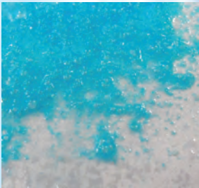
DIEP BLAUW (COCAÏNE HCL)